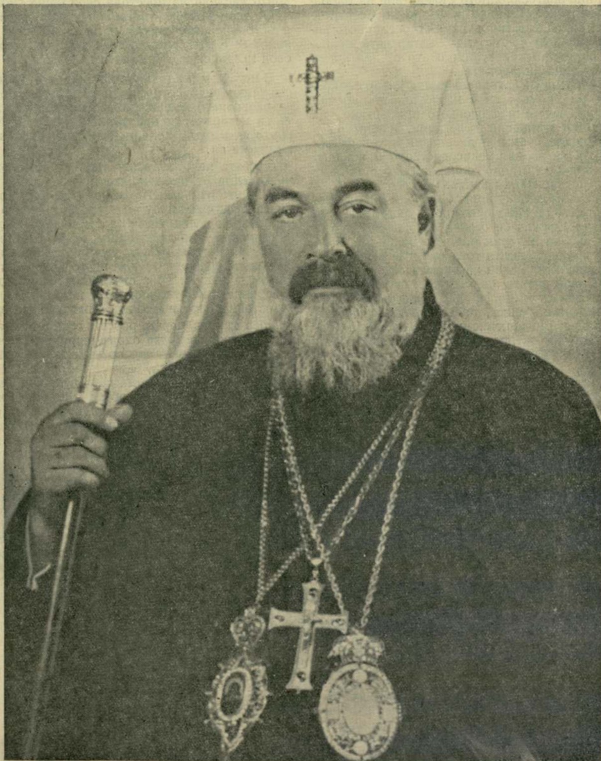
Негово Светейшество патриарх КИРИЛ По случай три години от възстановяването на Българската патриаршия и избора му за Български патриарх

ОРГАН НА БЪЛГАРСКАТА ПРАВОСЛАВНА ЦЪРКВА СЕДМИЧНИК ЗА РЕЛИГИОЗНА И ЦЪРКОВНО-ОБЩЕСТВЕНА ПРОСВЕТА