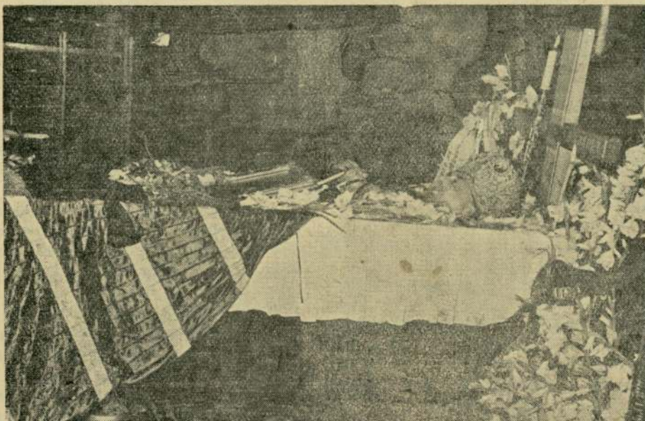
На смъртния одър

На 17. II. 1949 г. той бе избран за член на маления състав на Св. Синод, а от 7. VIII. 1954 г. той бе и председател на Върховния църковен съвет. До края на земните си дни той изпълнява-