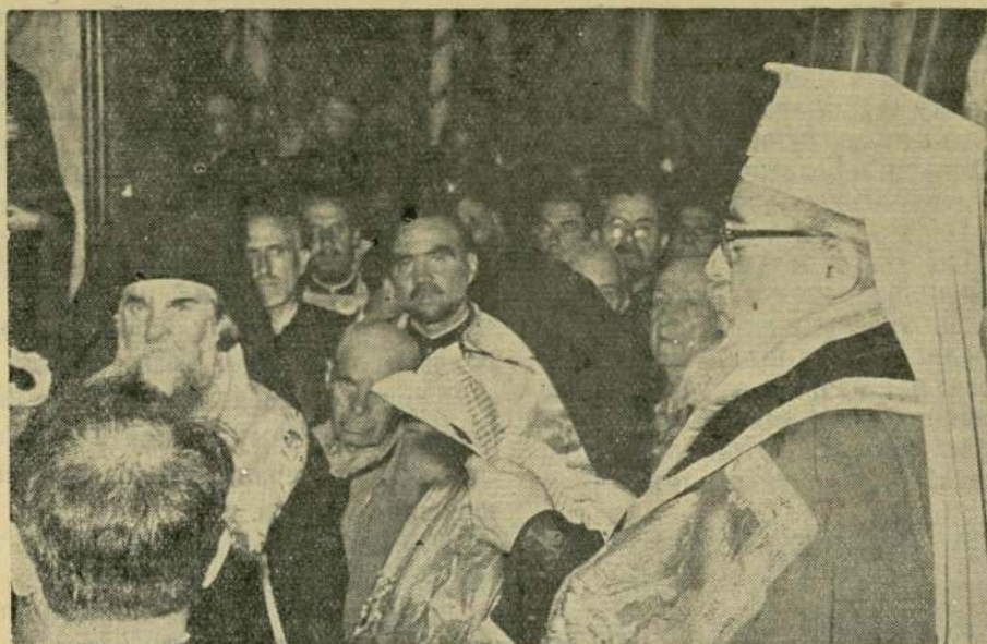
Негово Светейшество Патриарх Кирил произнася надгробно слово

нашния скъп покойник, блаженопочиналият Ловчански Митрополит Филарет, защото той живя с радост в Господа, а в дните му живееше вечността. Той знаеше, че е странник на земята и че земното човешко поприще е колкото педа, затова бдеше, за да печели малкото дни на живота и да придобие вечния живот в Бога.