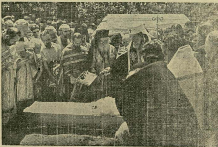
Негово Светейшество Патриарх Кирил прелива с вино и елей тялото на блаженопочиналия архиерей

И дядо Владика чу и се вслуша в Божия глас. По примера на Христа-Спасителя обхождаше той села и градове, благовестейки божественото учение и отблизо изучаваше духовните и материалните нужди на епархиотите си. Плод на тези грижи са