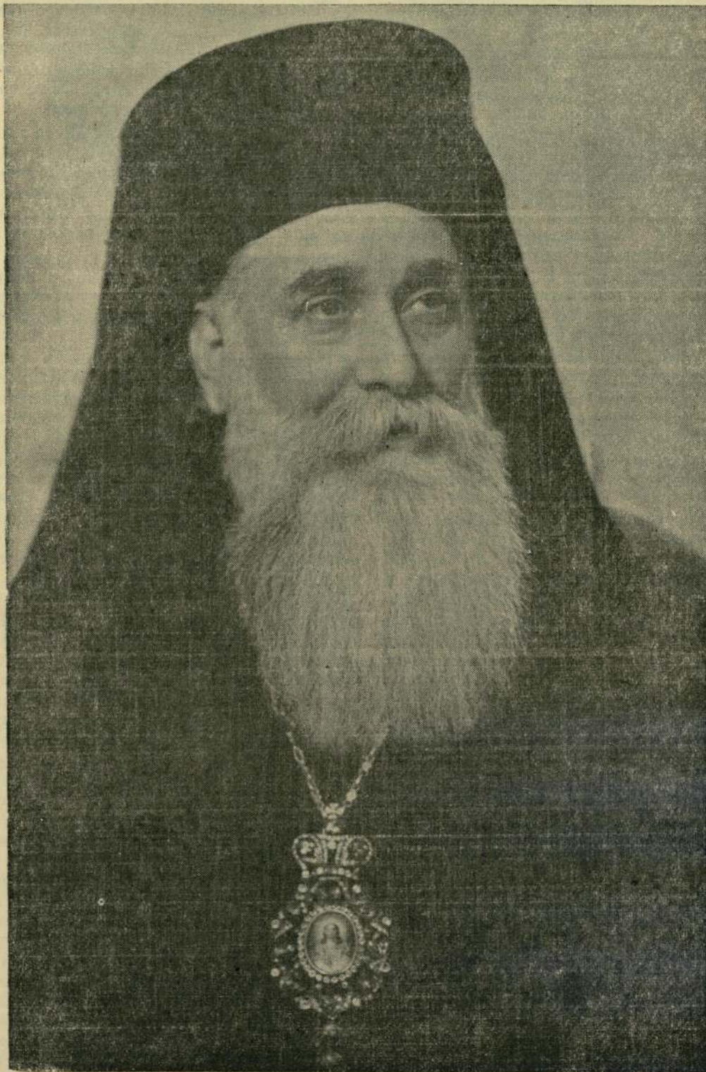
† НЕГОВО ВИСОКОПРЕОСВЕЩЕНСТВО СВ. ЛОВЧАНСКИЯТ МИТРОПОЛИТ ФИЛАРЕТ Роден на 26 септември 1903 — престаил се о Господе на 28 юни 1960

Адрес: София, ул. „Св. София“ № 2 тел. 8-29-83 сметка 110-11 БНБ — Софийски градски клон