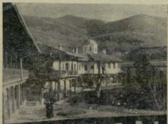
Капиновски манастир „Св. Никола“

Сред просторния манастирски двор, потънал в зеленина, се издига храмът, еднокорабна базилика, изграден изцяло от камък. Покривът се крепи на първостъб от хубаво издалан камък, който като носе то пристиги и крепи. От надясно, поставен на врата на женското отделение, е видно, че храмът е бил възобновен през 1835 г. по времето на игумена архимандрит