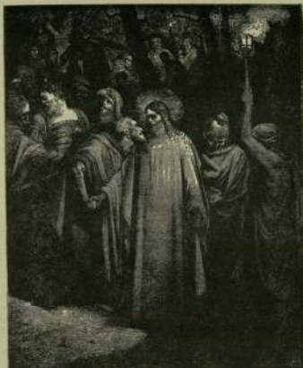
„Юда с целува ли предавам Сина Човечески“ (Лук. 22:48).

И когато вижда на Голгота изправения кръст и на него увенчано тялото на своя Учител, Юда изтръпла. Той наблюдава мъчително на Божествения Страдалец, вижда кълмчалата глава и долния последния стон: „свърши се“, наблюдава по-тъмното слънце и настъпалия по земната мрак, а в душата