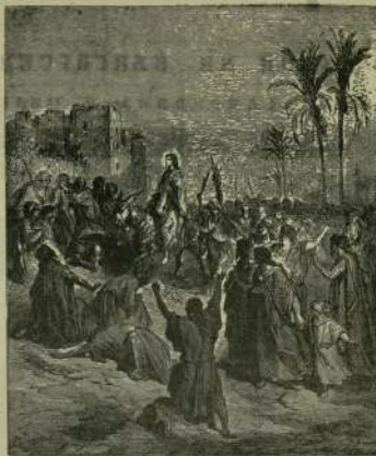
„А народът възвиждале и казваше: оселе Сину Давидово! Благославен Навлизът в Ние Господен! Оселе във вековете“ (Мат. 21:9)

Шест дни преди Пасха, в петък вечерта на 7 нисан, Исус изва отново във Витания, където беше възкресил Лазар и откъдето се бе отдалечил в гр. Ефраим. На следния ден, в събота на 8 нисан, Му е дълга голянка в дома на Симона Продажлив, в който участвуват и Лазар и на който Славролата сестра Марфа Го поманяла със същепомощно благоухано миро (Иоан. 12:1—3; Мат. 26:6). Витания била мал-