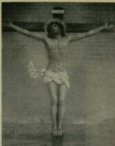
„Отец! Прости им, понеже не знаят, що правят.“ (Лука 23:34)

втората си проповед пред юдените казала: „Началника на живота убихте... Но аз зная брати, че вие, както и вашите началници, сторихте това по незнание“ (Дели. 3:15, 17).