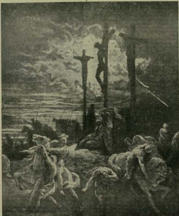
„Очи, в Твоите ръце предаван духа Си“ (Лука 23:46)

Убиец ли е Христос? — Не. Напротив, в град Наин Той възвръща към нов живот единствения си на бедна вдовица (Лука 7:14). В град Капернаум възкресява дванайсетгодишната дъщеря на Наир (Лука 8:55). В селото Витания въз-