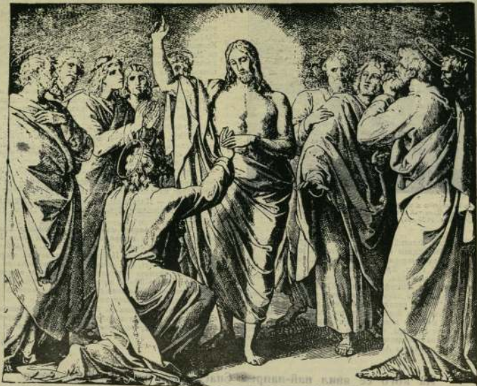
„... дай си пръсти тук в аки ръцете Ми; дай си ръката и турн в ребрата Ми; и не биди невярващ, а вярващ“ (Иоан 20:27).

вливши Божествен Младенец в Иерусалим за празник Пасха (Лука 24:1—51). Отбелязано е и нещото присъствие на сватбата в Кана Галилейска, където Исус Христос извърши първото чудо (Иоан 2:1—5). Най-после, евангелист Иоан съобщава, че тя е стояла под кръста Христова, и Разпятието й Син я поверил в гръдите на Своия любим ученик (Иоан 19:25—27). И това е всичко. Несъмнено е, че Божията Майка е била постоянно със своя Син, била е окръжена от Неговото внимание, слушала е Неговите слова и е наблюдавала Неговите чудеса. Поради това тя би могла да съобщи много