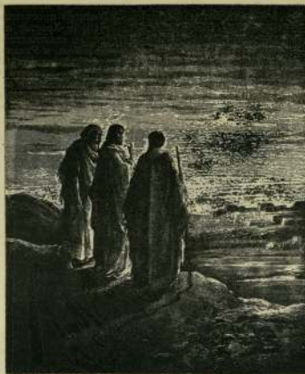
... 4. Присилени и мъченици по сърце да върват на всичко що си казала и пророкът! Или тъй гробане за остража Христос и да влезе в светата Сава! (Лука 24:25-26).

ним от Йосиф Флавий и в равнинската литература, бил отдалеч от Иерусалим на 160-170 стади (ок. 30-32 км).