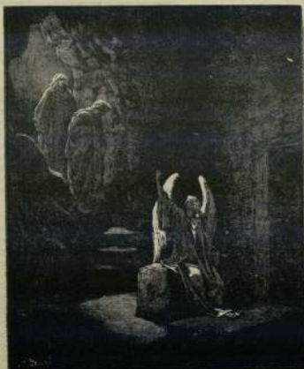
... те се плашат. Все търсите Иисуса Назаретца, разпитайте: Той • възкръсна, няма Го тука. Ето мястото, дето бе положен". (Мат. 16:6)

От юг отново птици долетват и всяка над звездото си връжи, от лек вятрец просторите здияват, а нежен път по влоните тежи, отърсени отдавна своя зичен сарей, и ний вървим с тоя светъл празник в гърдите с много слънце и копнеж.