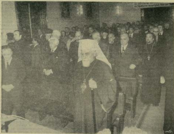
Момент от отварянето на съвместното събрание

дава мир там, където хората биват потискани, експлоатирани финансови и духовно; б) В процеса на реализиране, на възможности за мир възпитанието трябва да играе голяма и важна роля. Възпитанието трябва да служи за духовното осъществяване на хората и народите от Третия свят; в) Възпитателните системи на тези страни са все пак наследство от миналото. Те са се разгъвали до сега в атмосферата на капиталистическото съвещание за мира. Но в края на краищата те са довели хора на събитията до такова ситуация, която не може да се характеризира с издигане и искрен стремеж към мир; г) Ето защо съвременното възпитание от нас концентрира усилията за създаване на едно общество, за чиято развитие и прогрес ще бъдат използвани всички усилия и целият потенциал на хората.