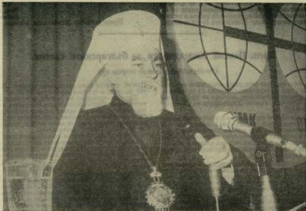
Негово Светейшество Българският Патриарх МАКСИМ говори на съвместното събрание на Младешката комисия при ХМК и представителите на Българската първова общностност за мира във Виетнам.

II. Възпитанието трябва да води до съзнание за политическа отговорност. То трябва да си поставя за цел приемствеността на съществувателна класова несправедливост в капиталистическото общество в Третия свят.