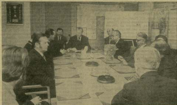
Посет на подкомисията от д-р Курт Валдайн, Генерален секретар на ООН

зация преработено и за член на Икономическия и социален съвет на ООН и Комитета на неправителствените организации ХМК намери ново широко международно признание на достигнатите си условия и постижения в борбата за мир в света и за разбирателство между народите, наличие между народния си престиж и получил нов импулс и в по-голяма възможност за своето последователно и неотклонно работно за осигуряване траен и справедлив мир в света и за изграждане живота на цялото човечество върху хуманни и социално-справедливи начала. Освен това ХМК ще оказва най-добра и пълна духовна и морална подкрепа на ООН, за да може тази световна организация да става все по-съвършен и по-ефективен инструмент за издобрение мир и справедливост в целия свят, за създаване благоприятни условия за сво-