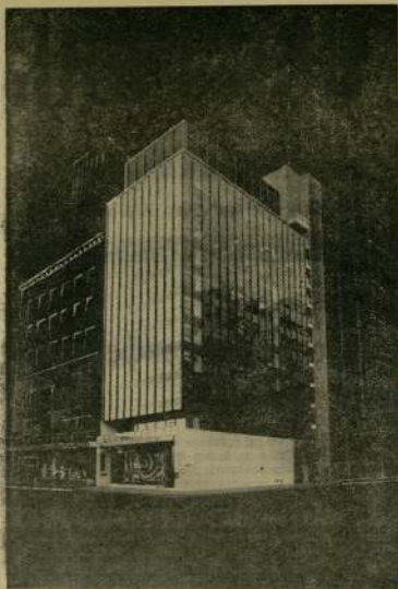
Сградата на Църковния център за Обединените нации в Ню Йорк