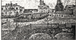
Храм "Св. Николай" (в центъра) и с. Сура

Целият живот на о. Ион Кронцадски представлявал непрекъсната и всеотрадна бла-