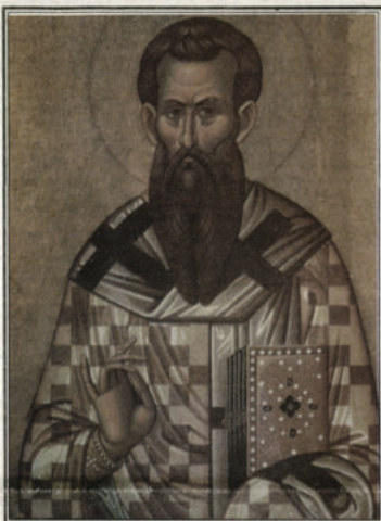
СВЕТИ ВАСИЛИЙ ВЕЛИКИ

Слово, произнесено в храм "Св. Николай", Враца, 1996 г.