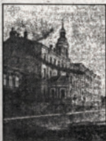
Домът на трудолюбие в Кронцад

ПРОДЪЛЖАВА АБОНИРАНЕТО за "Църковен вестник" и "Духовна култура" за 1996 г. Годишният абонамент за "Църковен вестник" е 500 лв., а за "Духовна култура" е 200 лв. Молим сумата да се изпрати с личния запис, в който да се изписва точният адрес и пощенският код на получателя!