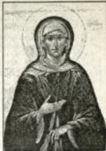
Бляк Ксения Петербургска

Клирът при Сиоленския храм се извалява от микрофон протояерей, включва в свещениците, двама дякоци и двама канонирис. При богослужението