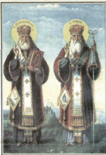
СВ. АТАНАСИЙ И СВ. КИРИЛ АЛЕКСАНДРИЙСКИ икона от 19 в.