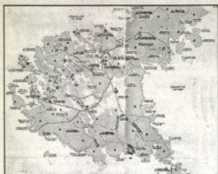
Продължение от бр. 4