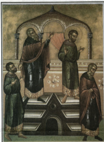
МИТАРИТ И ФАРИСЕЯТ

"... който превъзнася себе си, ще бъде унижен; а който се смирява, ще бъде въздигнат." (Лука 18:14)