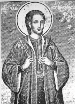
Св. великомъченик Георги Софийски, Нов