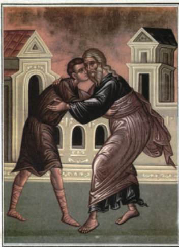
ЗАВРЪЩАНЕТО НА БЛУДНИЯ СИН

"... Тоя мой син въртеше кеше и оживя, изгубен кеше и се намерил..." (Лука 15:24).