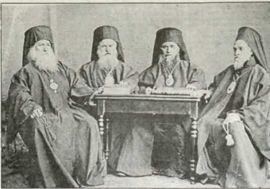
Първият Св. Синод на Българската екархия - 1871 г.

На 23-то заседание (14 май 1871 г.) на събора бил разгледан въпросът за покаяността или периодичната сменяемост на екарха. Възникнали ожесточени спорове, като становището на либералите за определен мандат упорито било защитавано от представителя на Софийска епархия Хр. Стоянов. Интересното в случая било, че мнението на архиепископите по този въпрос се разделило и Иларион Ловчански, Панкрат Пловдивски и Пассий Последвишки споделили мнението, че периодичната сменяемост на екарха била "ново въвеждане в управлението на Църквата", но че "не е антиканонично". Словеният диспут бил разрешен с тайно гласуване – от присъстващите 43 души, 28 гласували за периодичността на избора на екарха.