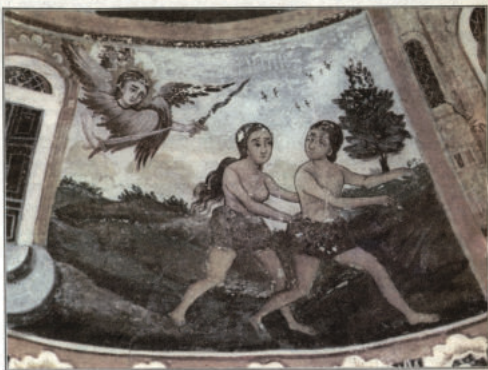
ИЗГОНЯВАНЕТО НА АДАМ И ЕВА ОТ РАЙ