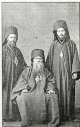
Първият български екарх Антим I с младите митрополити Григорий Доростолски-Червенски и Симеон Варненско-Преславски

ПРОДЪЛЖАВА АБОНИРАНЕТО за "Църковен вестник" и "Духовна култура" за 1996 г. Годишният абонамент за "Църковен вестник" е 500 лв., а за "Духовна култура" е 200 лв.