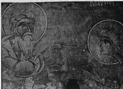
Стенопис от Египетския манастир

За живота и разказва преп. Зосима. Той бил строг монах, голим подвижник. И на неговата ву дошла изкушавателна мисъл: че една ли се намери някъде човек, който да го превъзведе в монашеския живот. Тогава чу глас: „Ако искаш да видиш в молитвите подвиг свят човек, иди отвъд Йорданската пустиня“. На следващия ден Зосима отишъл в манастира на св. Момн Превъзвезд, рато монасите веднаж съвършили ангелосторбени работи. Отдъхнал, поминал си при тихо и проръжлив глас па 20 дни навътре в пустинята. Стигнал при един пресъхнал извор по-