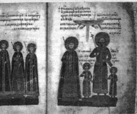
но делото на една рака.