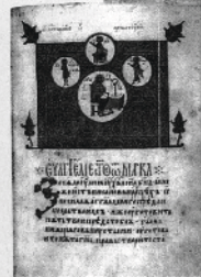
Продължение от бр. 16

Образ измъване на църквите образи в рыхълския и особено чрез изброяването на Иван Александър в края на всяко евангелие, редом със съответния евангелистик, художник се е стремил да подчертае божествения характер на владетел и глгностия на царя.