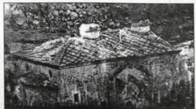
Полуразрушената църква на Дряновския манастир - май 1876 г.

В четвъртък на месец април 29-о - пише в записките си йеромонах Пахомий Стоянов - въстаниците влизат в манастира... част по пет по турски (т.е. 2 ч.