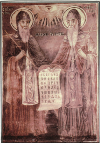
Тропар, гл. 4

Кирил и Методие богомъдрни, като равнин на апостолите и учители на славянските страни, молете Владиката на всички да утвърди славянските народи в православане и едномислие, да учини светата и да спаси нашите души.