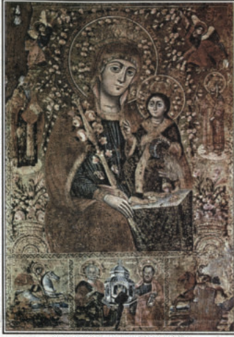
СВ. БОГОРОДИЦА – НЕУВАЖАЩА РОЗА Икона от храм „Успение Богородично“ – Сливен, 1836 г.

Полямо злочастия за човека е да губи зрението на сърцето си, защото се лишават от аснатише утехи на светлината. Лишава се от приятната наслада да сърдечна хубошесте на дивната природа. Сърбяна и тежка е участва на телесно слепоте хората. Ала много по-жалки и бедни са духовно слепите. Телесно слепите си в тежест на близките си с сами се мичат и страдат от недъстатъка си. Но те поне имат чисти сърдци и светли чуждета. Духовно слепите са лишени от тази вършечна благодат