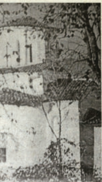
Манастир "Св. Архангел Митрев"

Красив архитектурен паметник представлява църквата "Св. Богородица" в съседното на Плевнския село Денковица. Това е новата църква на селото, построена в краята след Освобождението. Като изграфването на олтара, така и цялата църква представляват истински шедевр. Истински шедеври представлява и част от иконите, изграфването от миналестен художник, които изчезна на самата света Богородица. Църквата вечери и другичи. За съжаление сега църквата е в развалина, в иконите си изчезнали. И понеже става дума за димковската църква, изкушаване се да развика легендата за местността Полок дър, в които си е имало един селата църква на селото, макар то се е състояло от 10-12 къщи и е било разположено в местността, която сега се нарича Селище. Било на ден Великден. Цялото село било на църквата. Липсвала само пологата дъщеря, дъщеря и красова девойка. Свещеникът представлявал пещарката и се заплъдил