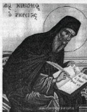
Св. Николай Светогорец

Знаем с голяма сигурност тези, които не се причастват постоянно, се лишават (о, нещастие!) от всички тези небесни и божествени блага, но при това стават и пресъхнали и запустели, както казвам предни това, и на Апостолските правила за съборя, и на всички свети, които прищодоме, и ще станат отговор-