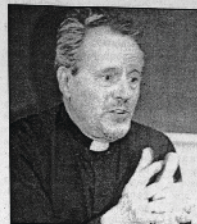
Отец Йован Майендорф

Няма друго канонично правило, което църковното Предание да защитава така категорично, както правилото, което забранява съществуването на дублиращи се църковни структури на едно и също място. Териториалното единство на църковната организация изглежда безспорно за оцелите от всички вселенски събори и в отстранено във всички канони, защото църковната дисциплина. Тук ще се опитаме да направим кратък преглед на каноничното законодателство на Църквата в тази област и да разкрием негово богословско и духовно значение.