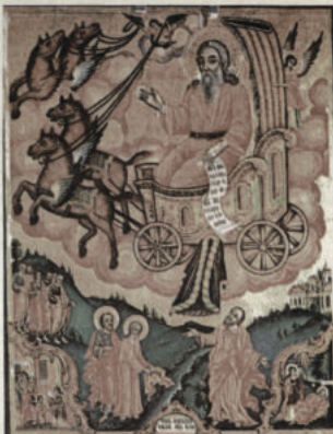
Св. пророк Илия на колесница Икона от църковата "Св. Атанасий" ана Варна от Захарий Цанков, 1856

Събитие, за което разсъждаваме, по време отдавна е минало. Но истината в него и сега живее, тя си е все същата. Вярносите двама слепци опитват своята "човекския дух" който постоянно копнее за пълна светлина... Ала хората не винаги учуват пътя към нея. Особено това може да се каже за нашето време и нашите съвременници. Жажда за светлина у всички сега е твърде голяма. Образование и просвета, това е желанието на всички. И мнозинството ги получава. Науката се развива, изучава се природата, прониква се в надлата на земята, изследват се небесните планети и морските бездни; изучава се външното "човекското" и външния "човекски живот"... При все това, получаваната по този път светлина сякаш не осветява, а загънява нещата. Човекитек дух сякаш не ваема участие в тая работа; той се чувства незадоволен и оставен в тьгосната мрачина. Очевидно, за него е потребна още някоя друга по-пълна светлина.