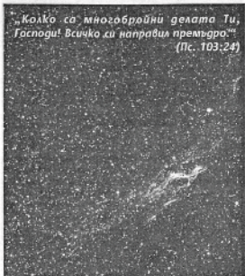
"Колко са многобройни делата Ти, Господи! Всичко си направил пръворо." (Пс. 103:24)

по едно или друго прикритие всяка човек добие и своето предназначение да облудва с Бога и да се радва на блаженна вечност. Несам в Библията, тази свята книга на Божиките откровения, но и във Великите (най-древният индийски авторитет на светината с религиозно съдържание), в които копнежите на човешката душа са намерили несполтават и невъзможни израз, съдем определено се говори за несполтават ценност на човешката душа и за високото ѝ предназначение поради нейното богоподобие. Исус Христос казва: