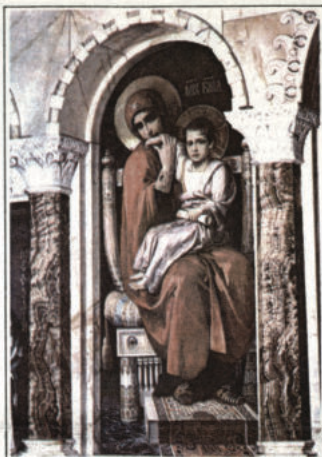
СВ. БОГОРОДИЦА С МЛАДЕНЕЦА

Отварна икона в храм-паметник „Св. Александър Невски“, рисувана от Ив. Мърванчик