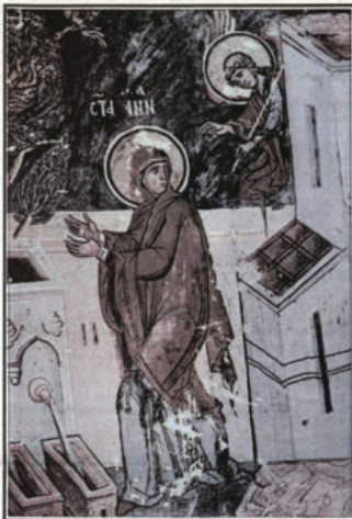
БЛАГОВЕЩЕНИЕ НА СВ. АННА