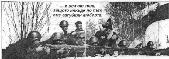
... и всичко това, защото нямкде по пътя сме загубили любовта.

Всичко казано дотук не е нещо ново - то съществува почти от сътворението на света, т.е. от първородния грех насама, но има и още нещо, което изглежда е породено от съвременната цивилизация, и то пресъгрва враждебността между хората и сътворява катастрофа с нежелани досега размери. За какво по-точно става дума?