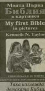
Така изглежда детската Библия

В този дух са и илюстрациите – шветни картинки, които възпрепятстват изграждането у децата на усет за свещеното и църковното.