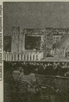
Сцени от руската опера „Княз Игор“ от Бородин, представена от Софийската опера на площад „Княз А. Батенберг“, София