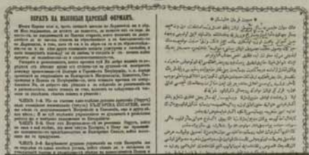
Факсимиле на фермана

и възбудени богомолци. След божествената Литургия и благодарствения молебен епископ Иларион Макариополски произнесъл възхитено слово. Между другото той казал: „... Трети април (1860 г. – Българският Великден) бе славен и знаменит ден, в който въпросът се роди и народното желание за народна йерархия изрази. Днес, Първи март 1870 г., е още по-славен и знаменит, защото се изпълни народното желание. Тогава бе раждането на въпроса, днес е изпълнението на въпроса. Тогава бе едно просто желание за въпроса, днес въпросът се облича с царски закон. Тогава бяха надежди, а днес е съществуването на надеждите. Жътва, чада, на сеча е посладка от сентбата, защото, който се с надежда, се с жътва. Който жъне, събира плод. Тъй и ний, чада, съежме на 1860 година, 3 април, жънем плода сега на Първи март 1870 година. Ето ви, чада, ферман, поддден вчера на