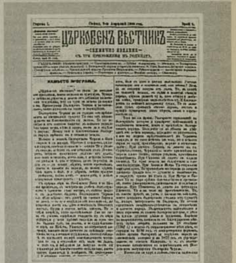
Заглавната страница на първия „Църковен вестник“, излязъл на 7 април 1900 г.

Друго безплатно приложение бил „Църковен архив“, чийто съставител и редактор бил Д. Мишев. Това са три сериозни тома с твърде интересни документи и материали по българската църковна история, отчетани в „Държавна печатница“. Първият том (обхващащ книги I и II) излязъл през 1925 г. В него са поместени твърде интересни документи за съграждането на първата българска църква „Св. Стефан“ в Цариград; материали по българския църковен въпрос, Първия църковно-народен събор, схизмата и т. н. Вторият том (фактически книги III, IV и V) излязъл от печат през 1929 г. и фактически е монографичен труд на големия църковен историк Иван Снегаров „Отношенията между Българската църква и другите православни църкви след превзгласването на схизмата“. Последният трети том съдържа интересни и разнообразни документи от нашето църковно минало (от 1789 до 1907 г.), като преобладаваща са документите от Българската екзархия.