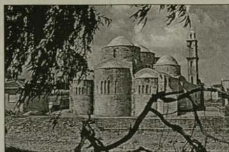
„Перистеронас“, 13 в., един от древните паметници на християнската култура на Кипър

Манастирът „Троадица“ – „Успение Богородично“ е мъжки манастир с няколко монаси, поддържащи се в него. Приеха ни с голямо внимание, при все че са заети около новостроящата се манастирска сграда. Същия ден привечер посетихме гробницата на архимандрит Макарий, бивш министър-председател на Кипър. Тя се намира на върха на възвишени-