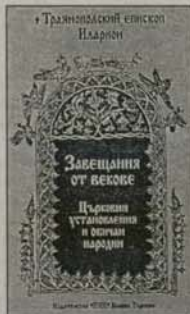
3. Завещания от векове Траянополски епископ Иларион Цена: 2,00 лв.