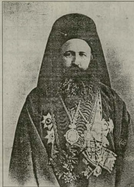
Екзарх Йосиф I

Публицистичната дейност на младия юрист съвпаднала с получаването на църковната независимост и с изграждането на Българската екзархия. Още докато редактирал сп.