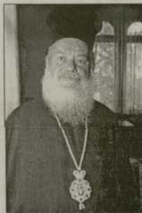
Митрополитът на Неаполи и Самария Амвросий, който озглавява делегацията на Йерусалимската патриаршия

Трябва да добавя и това, че Йерусалимската патриаршия винаги е била в подкрепа на Българската сестра-църква. В бурните години на миналия век, например, когато