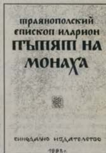
5. Пътят на монаха Траянополски епископ Иларион Цена: 1,25 лв.

в „Църковен вестник“, бр. 9, 1-15 май 2000 г.