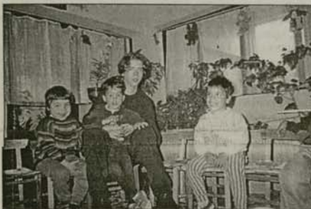
Деца-сирачи със своите нови приятели от Софийската духовна семинария

Учениците намериха сърдечен поддрон в Лопушанския манастир „Св. Иоан