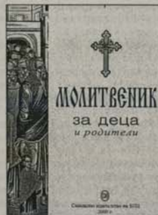
4. Молитвеник за деца и родители Синодално издателство Цена: 2,00 лв.