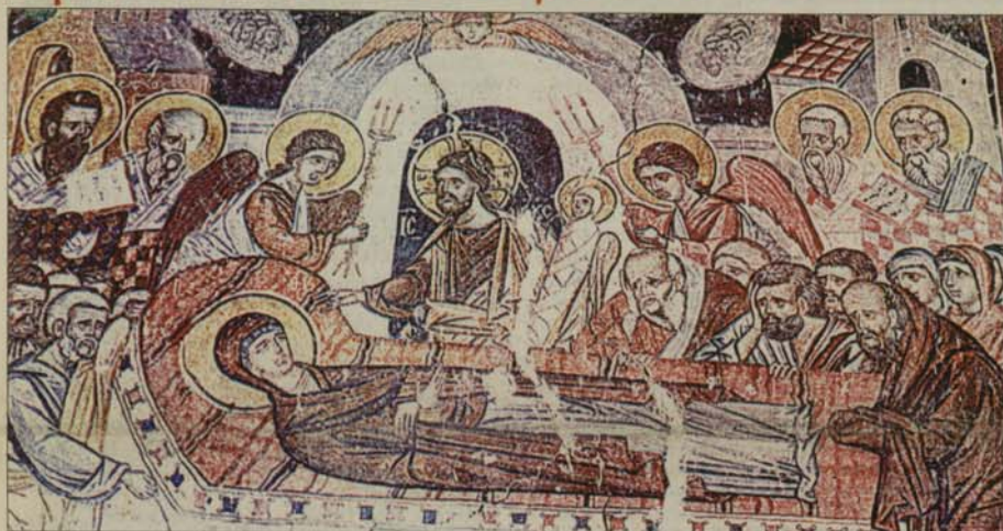
„Успение Богородично“ - стенопис от Струпецкия манастир, XVII век