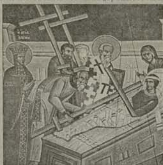
Момент от напирването на св. Кръст Христов

Празникът Въздвижение на честния и животворящ Кръст, който Православната църква чества на 14 септември, отбелязва няколко събития от историята на Християнската църква.