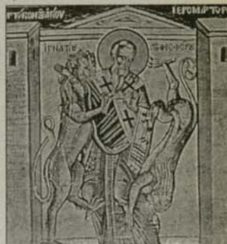
Мъченичката смърт на св. Игнатий Богоносец

Според еднородното свидетелство на всички извори християните са били най-съвестните граждани на Римската империя. Те били най-дисциплинирани, най-организирани и най-добри служители. Християнските войници в римски-