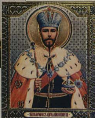
Св. благоверен цар-мъченик Николай II

От всички московски храмове се стекоха литийни шествия, които се съединиха пред храма на Христа Спасителя. Стотици хиляди вярващи изпълваха площада и улиците.