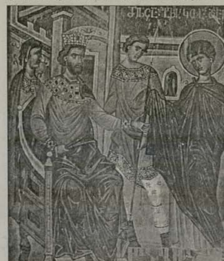
Св. влчк Георги пред император Диоклециан Гръцката дума за мъченик означава свидетел. В ранните времена на християнството свидетелството на вярата чрез живота и „дори до смърт“ е била единствената проповед на християните срещу всички заблуди на обществото. Обновлението на хората чрез „нов ум в Христа“ обновило и обществото

Съществува и друг, още по-силен мотив да се молим за императорите, дори за преуспяването на цялата империя и за римското могъщество. Ние знаем, че оградната заплата, надвиснала над земята, и краят на този свят, който ни застрашава с ужасни бедствия, се забавя от постъпвателното развитие на римската империя. Ние не искаме да изпитаем тези ужаси и, като се молим за отпочоката им, всъщност крепим просъществуването на Рим.