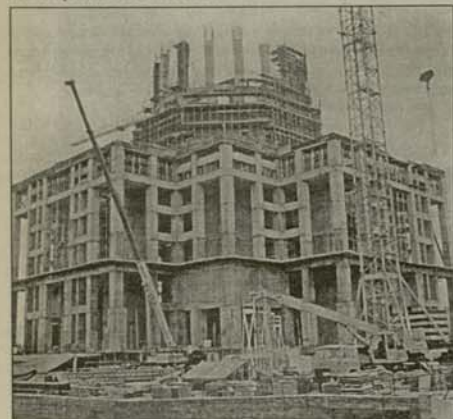
Октомври, 1995 г. Начало на възстановителните работи

конто в тези трудни времена прояви руският народ, и за оздравяване на нашата благодарност за проми-