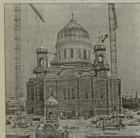
Февруари, 1997 г.

Величественият храм строят в продължение на