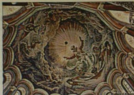
Стенопис от купола на храма

На 31 май 1994 г. правителството на Русия със съгласието на Московската патриаршия приема постановление, с което поставя началото на възстановяването на храма. На 7 януари 1995 г. на храмовия празник – Рождество Христово – цялото Московско духовенство начело със Светейшия Московски и на цяла Русия патриарх Алексий II, съпроводени от множество богомолци, в литийно шествие се отправят от Успенската катедрала към мястото, където предстояло да бъде издигнат главният храм на Русия. Патриарх Алексий II в присъствието на председателя на правителството на Русия В. Черномырдин извършва тържествен молебен с полагаене камък и паметна капсула във основата на възстановявания храм. Ускорените темпове на строителство дават възможност още на 23 април същата година в храма да бъде извършена пасхална вечерня от Руския патриарх в съслужение с многочислено духовенство. Това първо патриаршеско служение след полагаене основите на храма, тъй като все още липсвали стени и сводове, се извършило под открито небе. През 1996 г. храмът ве-