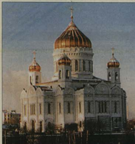
Възстановеният храм на Христос Спасителя в Москва

Делегация на БПЦ во главе с Българския патриарх Максим участва в освещаването на храма на Христос Спасителя