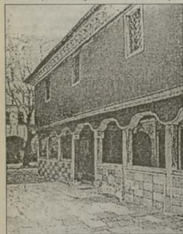
Църквата „Св. Константин и Елена“, под чието основие са намерени останки от раннохристиянски храм

313 г. Пловдивската раннохристиянска община дава мъченици на вярата. Това били 37 войници (в исторически документи са 38, защото към тях се прибавя и св. Дионисий Ставнишки) от римския легион в града. Известни са имената на двама от тях, св. Севериан и св. Мемно, които били родени в Пловдив. След Миланския едикт