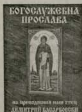
1. Богослужебна прослава на преподобния наш отец Димитрий Басарбоски Цена: 1,50 лв.