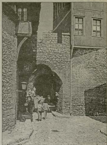
Хисар капия (източната порта) близо до която според преданието са загинали мъченическите св. 37 Пловдивски мъченици

Разпространението на ересите в района на Пловдив често е свързано с решения по-скоро от полити-