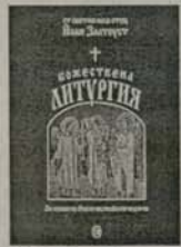
3. Божествена Литургия на св. Йоан Златоуст Синодално издателство Цена: 2,00 лв.