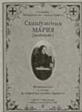
2. Схигумения Мария Макариополски епископ Гаврил Цена: 1,60 лв.