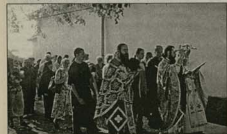
Момент от обновлението

гелов, а по-късно и о. Серафим Петров. Сдариенията от енориите рещават да извършат пълно обновление