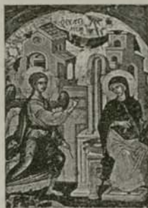
Три изображения, които според православната традиция не са в противоречие със „София“ – Благовещение и Христос като Премъдрост Божия, и историческата личност св. мчца София заедно с нейните дъщери Вяра, Надежда и Любов

Грешат онези, които смятат, че евентуалното