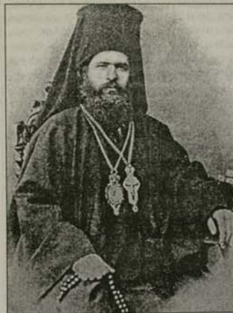
Скопски митрополит Теодосий

Митрополит Теодосий е една изключително интересна и малко позната личност в историята на Българската православна църква. Той взема