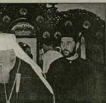
Негово Светейшество Българският патриарх Максим благославя богомолците в обновения храм