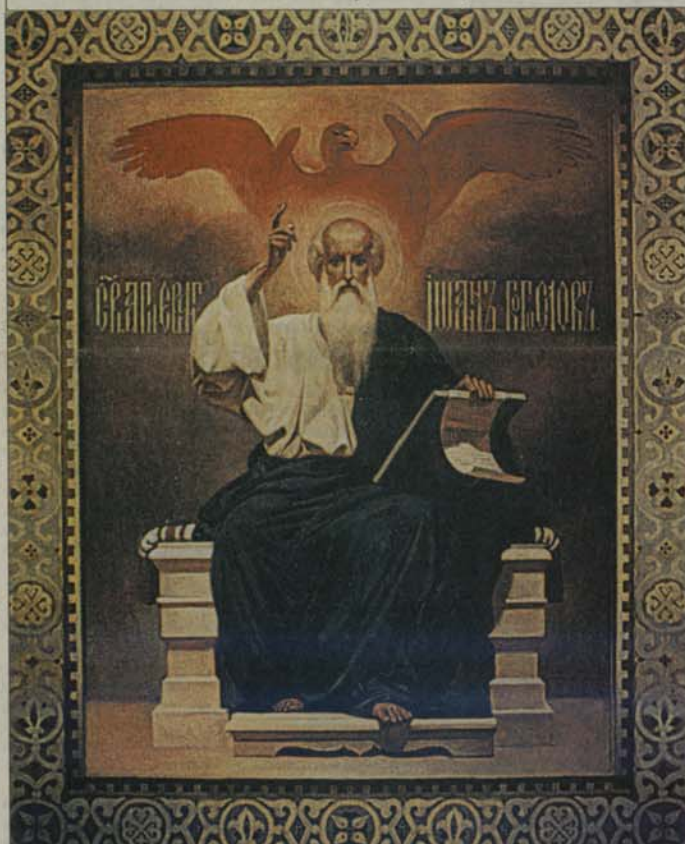
Св. апостол и евангелист Йоан Богослов Проект за стенопис в московския катедрален храм на Христос Спасителя

Св. Йоан Богослов – най-младият сред апостоли, възлюбеният от Спасителя юноша, който на Тайната вечеря склонил глава на Неговите гърди, Зеведевият син, бедният рибар, който поради пламенната си любов към Господа бил удостоен с такова просветление от Светия Дух, че достигнал орлови висини в богословието, първият, на когото Църквата дала изключителното звание Богослов.