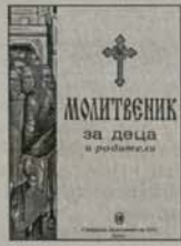
4. Молитвеник за деца и родители Синодално издателство Цена: 2,00 лв.

Освен цената на избраните книги читателите заплащат и пощенските разходи: за 1-2 книги - 0,70 лв.; 3-4 - 0,90 лв.; 5 до 8 - 1,10 лв.; 9 до 15 - 1,60 лв.; 16 до 20 - 2,20 лв.; 21 до 24 - 3,00 лв.; 25 до 32 - 3,60 лв.