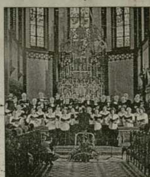
Концертът на хора в катедралата „Св. Антоний“, Вроцлав

2000-годишнината от Рождеството по път на нашия Господ Иисусе Христос се отбелязва от всички християнски народности по интересен и колоритен начин. Древният град Вроцлав в Полша съчета това събитие с 1000-годишната си история и 35-ия Музикален фестивал „Wratislavia Cantans“.