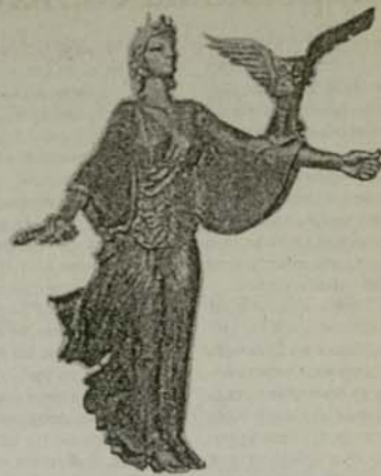
Т. нар. „Св. София“, автор Георги Чапкънов. Една късна, но много типична проява на стила „социализъм“ с християнска насоченост. Излязо подходяща за художествения ансамбъл на ИДК – със или без „света“.

Социализмът си остана и като дух, а и като изразни средства. Темите и сюжетите може да са по-различни, може да са даже църковни, но това не променя особено нещата. Това, че естрадните певци започнаха да правят клипове си в църкви, нищо не означава. Атеизмът, за разлика от истинската вя-