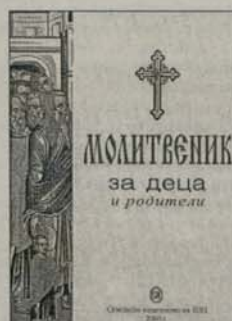
4. Молитвеник за деца и родители Синодално издателство Цена: 2,00 лв.