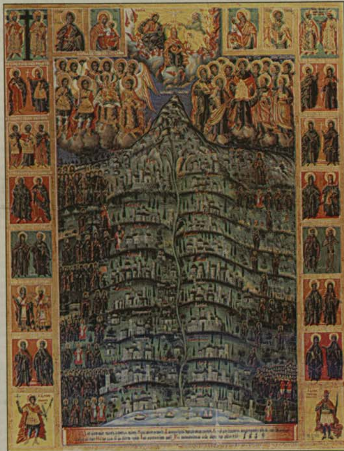
Света Гора – общ поглед. Икона от Атон, 1859 г.

бездуховния делник търсим не само духовни убежища, но и духовни авторитети, примери за подражание.