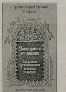
3. Завещания от векове Траянополски епископ Иларион Цена: 2,00 лв.