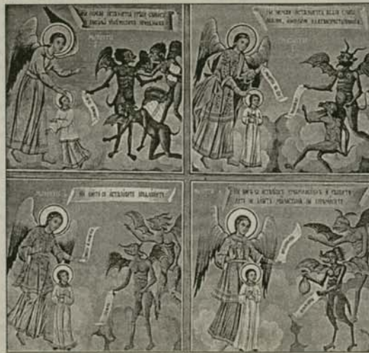
Стенописи от Рилския манастир

листични. Те изобразяват онова, „което сме видели и което сме пишали“ – човешката природа на възлюбения се Бог Слово Исус Христос. Наред с това виждаме и други исторически личности – Божията Майка, св. апостоли, мъченици и изповедниците на вярата, църковните йерарси и подвижници. Те придобили в себе си Божията благодат и свидетелствали за нея пред света.