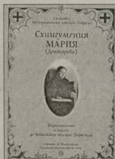
2. Схигуменция Мария Макарлопски епископ Гавриил Цена: 1,60 лв.