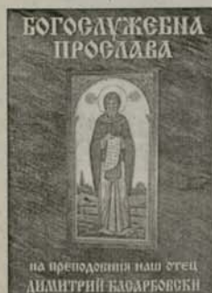
1. Богослужбена прослава на преподобния наш отец Димитрий Басарбовски Цена: 1,50 лв.