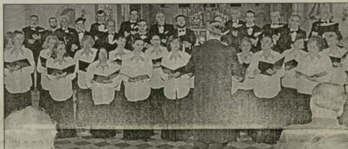
Момент от изпълнението на хора в базиликата „Св. Кастор“ в Кобленц

Певците на „Св. Александър Невски“ отпразнаха своето пожелание „На