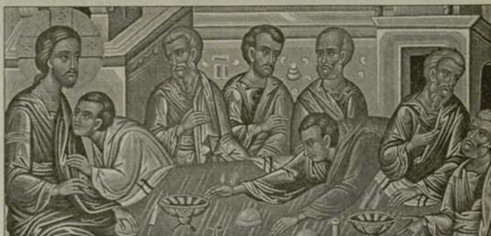
Детайл от Тайната вечеря. Само предателят Юда е изобразен в пълен профил

Молитвите им нерядко извършвали чудесно, невярно обръщане в закоравелите сърца.