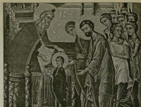
Въведение Богородично. Детайл.

Християнският брак като богоустановен съюз налага редица задължения между съпрузите, от една страна, и между родители и деца – от друга. За това говори св. ап. Павел в посланието си до Ефесяни, глава 5: „...живейте в любов, както и Христос ни възлюби, ...като се покоряваше един другиму в страх Божий... Вие, жените, покорявайте се на мъжете си като на Господ... Вие, мъжете, обичайте жените си, както и Христос обича Църквата и предаде Себе Си за нея... Тъй са дължни мъжете да обичат