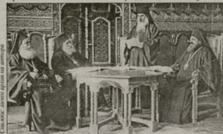
Наместник-председателят Врачански митрополит Климент чете доклад пред намаления състав на Св. Синод, София, 1920 г.

фан“ в Цариград архимандрит Климент е хиротонисан в епископски сан с титлата „Бранички“, като от същия ден по желание на епископа е назначен за управляващ Ловчанска епархия, на който пост остава до 1914 г. На 19.01.1914 г. Бранички епископ Кли-