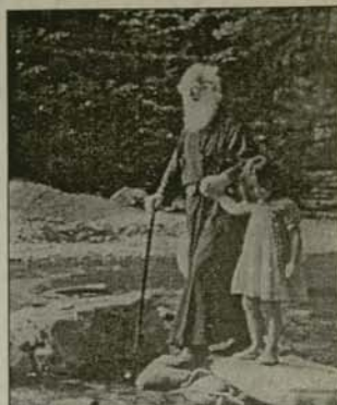
вяването на което водещо е не внушението и въздействието откъм, а естественният стремеж на чистото човешко сърце.

Водещо при възпитанието на децата във всяка една възраст трябва да бъде възприемането и отношението към тях като самостоятелни личности и зачитането на свободната им воля. Това важи с още по-голяма сила при полагане на основата на религиозния им живот. В този смисъл е добре да се подчертава, че послушанието към Бога не трябва да произтича от задължението към родителите. То е плод на личното общение с Бога, при устано-