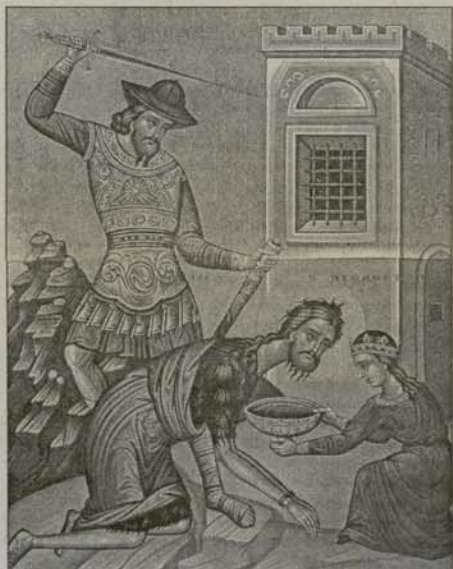
Отсичане главата на св. Йоан Кръстител

Праведниците са прояснили в душите си образа Божий, очистили са го от греховната кал, той сияе