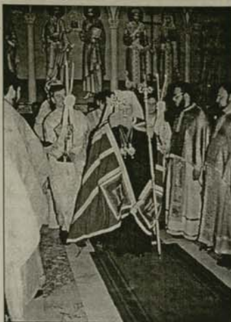
Посрещане на Българския патриарх Максим в семинарския храм

С възлине дочакахме вечерта на 12 ноември, когато бе отслужена празнична вечеря. Тържественният ден започна с утрения. Празника почетоха кметът на Пловдив д-р Ив. Чомаков, деканът на Богословския факултет при СУ „Св. Климент Охридски“ доц. д-р Ив. Ж. Димитров, проф. д-р Тотю Колев, ректорът на Софийската духовна семинария архи-