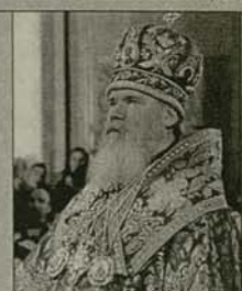
Руският патриарх Алексий II

топ Платон към дика на светите новомъченици и изповедници бе извършено в храма на Христос Спасителя в Москва на 20 август. На канонизацията присъства и делегация на Цариградската патриаршия. Ревелския епископ Платон е претърпял мъченическа смърт на 14 януари 1919 г. като викарий на Рижката спархия на Руската православна църква и никога не е бил клирик на Цариградската патриаршия.