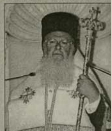
Цариградският патриарх Вартоломей

Клириците на Естонската православна църква под юрисдикцията на Московската патриаршия не са влезли в църковно общение с пристигналата в Естония делегация на Цариградския патриарх, считайки го за отговорен за разкола в православната общност в Естония. Православните депутати в Парламента на Естонската република са споделили: „Очакванията на вървящите, че посещението на патриарх Вартоломей в Естония ще доведе до нормализация на правата основа на религиозната дейност на православните енории, не се оправдаха.“ Депутатите са