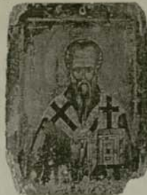
Св. Климент Охридски – небесният покровител на Софийския университет