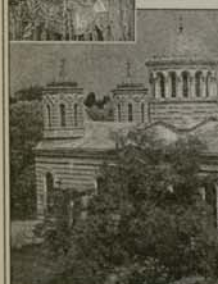
Храмът „Св. Николай Софийски“

През 1900 г. в София е построен храм в памет на св. Николай Софийски, загинал мъченически през 1555 г. В близост до храма е и мястото, където е бил изгорен на клада светецът-мъченик. Първоначално там е имало