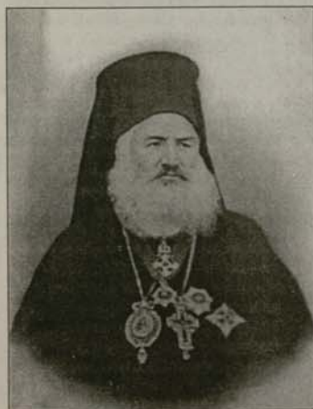
Слика: архиепископ Иларион

Митрополит Иларион е скромен и тих архиерей, отдал своето здраве и сили за укрепването и възхода на Неврокопската епархия, непосредствено след Освобождението на България. Светското