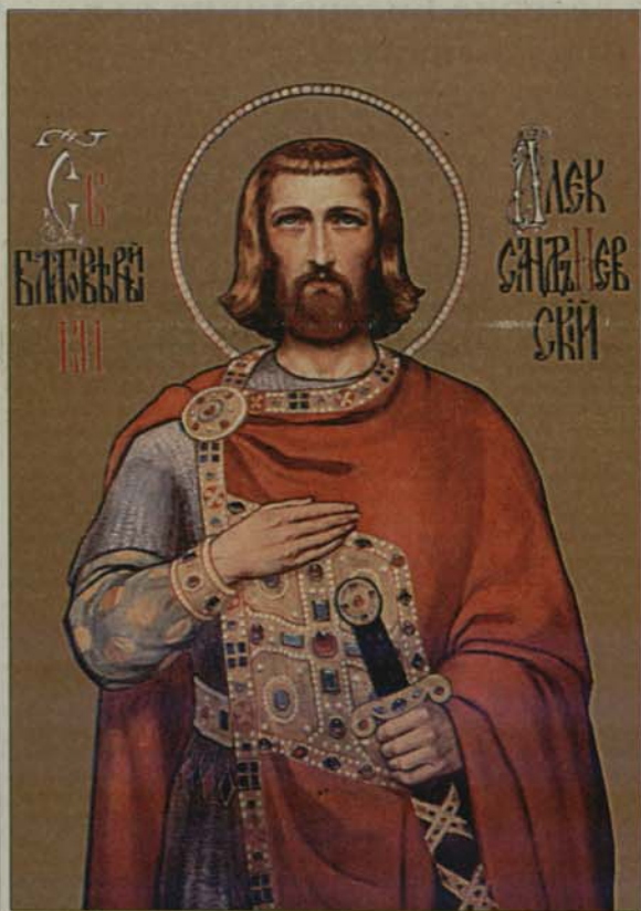
Новата икона на св. Александър Невски, осветена на храмовия празник

Това светоотеческо разбиране на древната Църква за раждането е съхранено и днес. Според дякон Андрей Кураев, съвременен руски апологет: „Образът на раждането в православната традиция е двоен: от една страна, Бог ражда Себе Си сред хората, а от друга, човекът ражда в себе си Бога.“ Св. Симеон Нови Богослов намираща точните думи: „Съдържащият всичко се заселва във вътрешността на човека и човек става като непознава жена.“ И още: „Човек съзнателно носи в себе си Бога... Когато се каем и вярваме от цялата си душа,