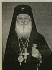
Видинският митрополит Дометиян

В дните около празника Въведение Богородично в епархията се проведоха църковноправославни прояви във връзка с Деня на православно християнско семейство и младеж.