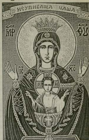
Чудотворната икона на Божията Майка „Неопиваща чаша“ се намира във Високия манастир край гр. Серпухов, Русия

ви към Света Богородица за изцеление от този порок, а много отивали в манастира, за да благодарят на Владичицата за оказаната от нея велика милост. Какво е изобразено на тази икона? Като иконография тя се отнася към типа на едно от най-древните изображения на Божията Майка – „Оранта“, само че Богомладенциът е нарисуван стоящ в чаша. Чашата е благославяща Богомладенциът – това е чашата на Причастие-