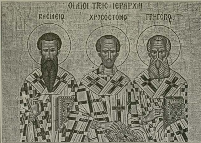
Св. Василий Велики