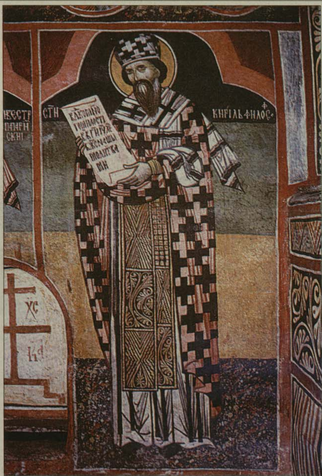
Св. Кирил Философ