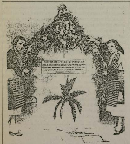
Венец на Макария Фръчковски в Пазарджик