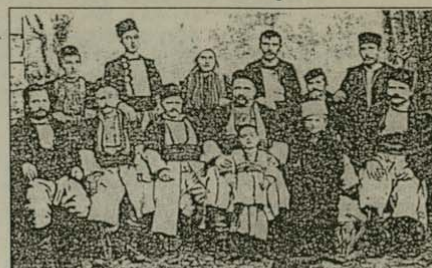
Резбари от фамилията Филиповци от с. Осой

– във Видинска епархия – катедралата в гр. Видин – цялата резбарска работа на храма „Св. Димитър“, църквата при Митрополития – Видин, Голямата църква в Лом, Василовци, Росово,