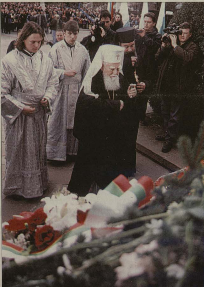
На 19 февруари Българският патриарх Максим понесе цветя пред паметника на йеродякон Игнатий (Левски). Повече за събитието четете на стр. 2

Изследванията на проф. Иван Панчовски и Васил Боянов (в книгата „Левски и Ловеч“) също така установяват, че