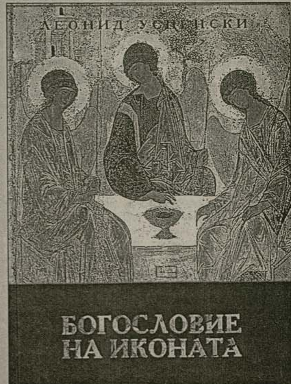
Леонид Успенски е един от най-значимите иконографи и иконолози на XX век. Потомах на руски емигранти след болшевишката революция, той живее и твори в Париж, където се престава в Господа през 1987 г.

Съвременното, това е най-достъпното въвеждане към историята и богословието на иконата и е основен текст, върху който се градят повечето от съвременните изследвания в областта на иконографията.