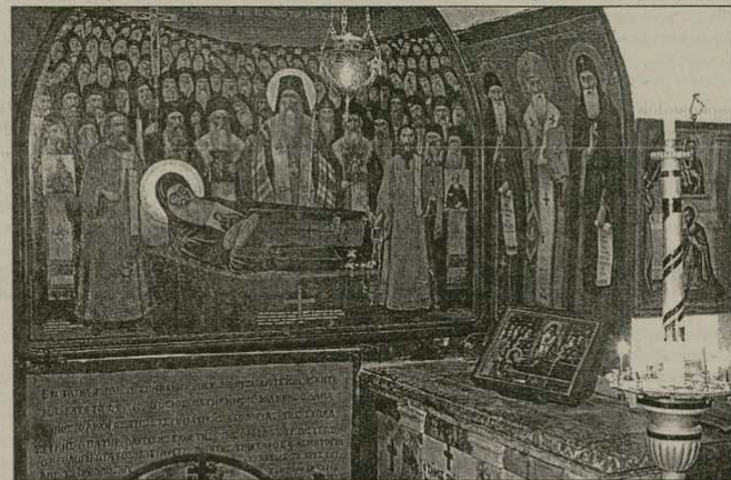
Паракистът с гроба и пещерата на св. Йоан Дамаскин в манастира „Св. Сава Овощени“, Палестина

ложество, зли желания и всички противостествени и срамотни страсти, кражба, обирание на светини, разбойничеството, убийство, телесно отпускане и наслада от сенията на плътта (когато тялото е по-здраво), гадателства, магии, заклинания, тиснегателство, клокарство, коктени-