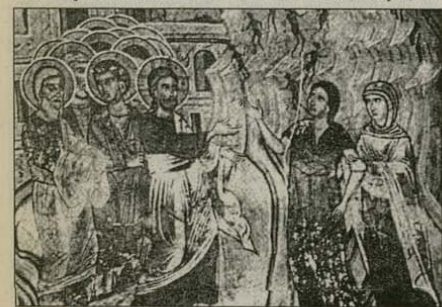
Христос изгонва демони