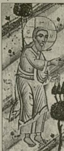
Бог е створил човека „мъж и жена“ (Бит. 1:27)

ме подкрепата на държавата като приемник на християнските ценности в своето законодателство и социална политика. Византийският период на Църквата е безвъзвратно отминал. Юстиниановата „симфония“ може да бъде само идеал. Връща се древноотечествено, но не с лавров венец и в това, а с костюм от „Армани“, скъпи интелегентски очила и елегантно кюфарче. Триумфа и варварството. Този път – не на кон и с копие в ръка, а по Интернет, по кабелната телевизия или по дискотеките петък вечер.