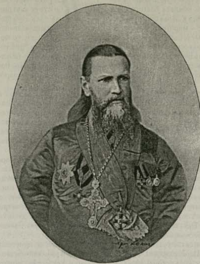
Истински Глава на Църквата – Христос.“

Необходимо е да принадлежим на Църквата Христова с Глава Всеомогъщия Цар, Победителя на ада Иисус Христос. Неговото Царство е Църквата, воинстваша с началата, властите и силите на мракка, с поднебесните духове на злобата, които воюват опитно и силно с всички люде, защото са изучили страстите и наклонностите им. Цяло едно общество, но неправославно и без Главата Христос не може да направи нищо с такива хитри, постоянно бодърствани врагове, превъзходно изучили науката на своята война. На православния християнин му е необходима Божия поддръжка свише от Сина и от св. воини Христос, победили враговете на спасението със силата на благодатта Христова. Православната църква, към която по Божия милост принадлежим, пастирите и учителите, обществена молитва и тайнствата могат да помогнат на християнина в борбата с невидимите и видими врагове. Католиците са измислили нов Глава, унижавайки Единствения