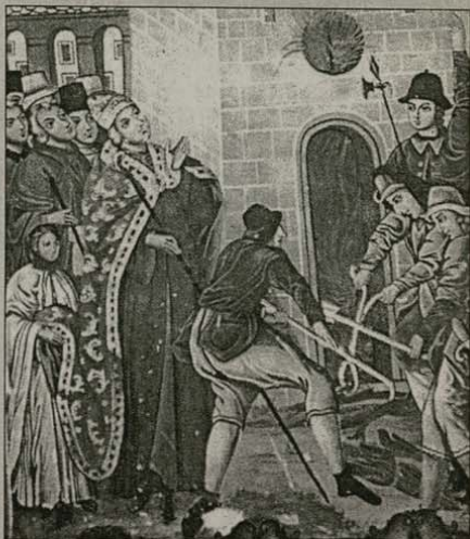
През 1278 г. папски пратеници се опитали със сила да принудят зорографските манастири да приемат униата. Манастирите предпочели смъртта пред съзвучието с римокатолицизма. Детайл от стенопис, представящ изгарянето на 26-те Зографски мъченици. Зографски манастир, Атон

Ако видиш, чедо, друговерци да спорат с правос-