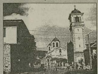
Темевенската църква със старите камбани

Темевен са прекарани за 30 дни с волска кола и после са окачени на камбанарията. Но гласът им се чува едва на 1 ноември 1877 г., когато руските освободителни войски влизат в града. Със стрелителна атака отрядът на полковник Орлов освобождава Темевен. Но падат жертва руските солдати Ефим, Станислав, Тихон и Герасим. Начело на вли-