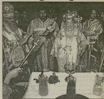
На 7 април, Неделя Кръстопоклонна, след св. Литургия с литийно шествие Негово Светейшество патриарх Максим с архиереи и свещенослужители на БПЦ се отправя към миротека в Синодната палата. Там Негово Светейшество освети и положи основните материали за мироваренето

През тази година се наложи нашата Църква да свари ново миро. Св. Си-