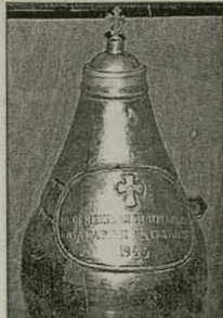
Специалният съд, наречен „алабастр“, в който се съхранява св. миро, подарено от Цариградската патриаршия на Българската православна църква по повод отпадането на схизмата през 1945 г.

новната маса на мироварния състав е чистият маслинен елей. Останалите вещества представляват различни благоуханни смоли, тревни, корени, етерични масла и есенции. Също така се използвало и бяло вино, което служи за предаване на врящия зехтин от прегаряне, а подсиле-