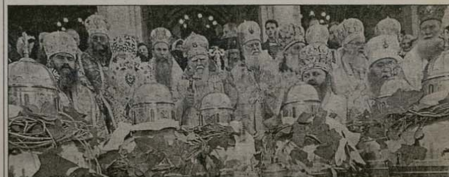
На Велики четвъртък след св. Литургия новосвареното миро бе осветено в олтара на патриаршеската катедрала „Св. Александър Невски“ от Негово Светейшество Българския патриарх Максим в съслужение с архиереи и свещенослужители на БПЦ