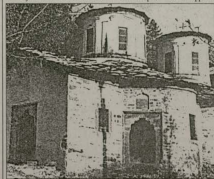
Манастирът „Св. Илия“ в Темевен