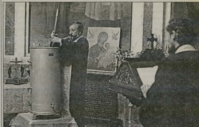
Момент от мироваренето, което се извърши от Велики понеделник до Велика сряда в притвора на патриаршеската катедрала „Св. Александър Невски“. Светената течност се разбърква от свещенослужители при четене на св. Евангелие