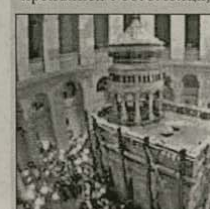
Св. Кувуклия в храма „Възкресение Христово“ в Йерусалим при тазгодишното слизане на благодатния огън на Велика събота

Тази година на Велика събота храмът отново бе претъпнен с богомолци, които се молеха пред св. Ку-