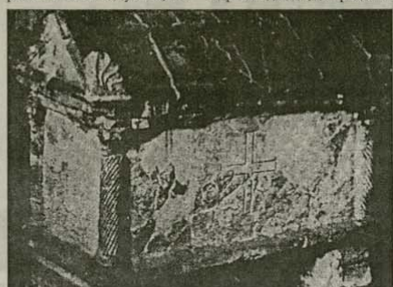
Саркофагът на св. Дазий Доростолски от IV-V в. в гр. Анкона – Италия

и. с. к. и. н. Г. АТАНАСОВ Из публикация във в. „Духовен светилник“ от 6 април 1993 г., стр. Силистра