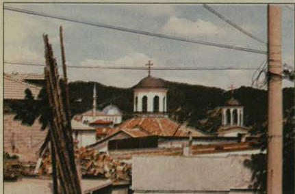
Изглед от с. Старцево

Седмте дни на Светлата седмица – седем глътки жива вода от чистите родопски извори на вяра и благочестие