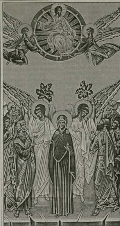
Тропар, глас 4

ричат храма – небе на земята. Всички тези отговори означават едно: небе – това е името на нашето истинско призвание, небе – това е последната правда