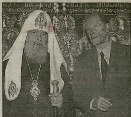
Министър-председателят Симеон Сакскобургготски по време на срещата с Руския патриарх Александрий II

Бе засегнат въпросът за продължаваща все още разкол в БПЦ, като бе из-