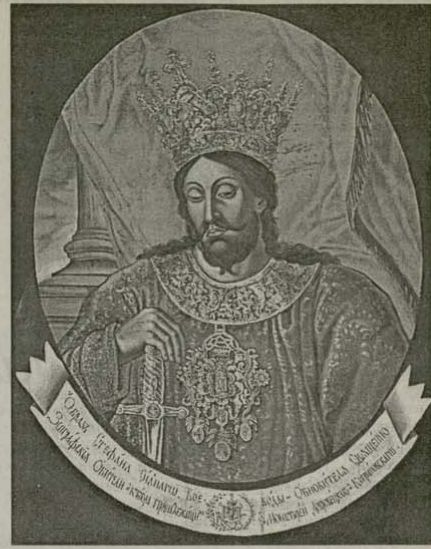
Портрет на Стефан Велики от гостиницата на „Зограф“. Генадий Монах, 1849 г.

На стенописното изображение в притвора на храма са изобразени още трима молдавски воеводи.