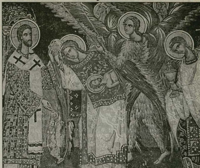
Иконографско символично изображение на Небесната Литургия

Заплатили веднъж св. Симеон Нови Богослов какъв трябва да бъде свещеникът. Той отговорил: „Аз