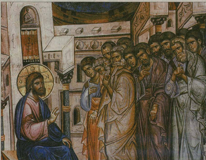
Христос сред апостолите като Учител

Царството Божие е дар, обновяване на живота и неговите възможности. Дар, който ние получаваме чрез общението „в плътта и кръвта Христови“, в истинското единство на тварното и нетварното. Нашето собствено съществуване, личността ни различие не са самостоятелни величини, но също са дар, който придобиваме подобно на дара на вечния живот чрез изменението на образа на битието. Бог Свети Дух – това е оживотворяващата ни сила и началото на всеки живот. Той дарува битие и ипостас (лице) на нашата личност като екзистенциален отговор на призива на Неговата „безумна любов“. Той обновява и нашата тварна природа, като въздига „новия човек“, съединявайки божеството и човечеството „в плътта“ на Христос.