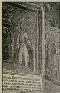
Стенопис на св. Константин в „Бельовата църква“, 1867 г.

Настоящият текст представя житието на един почти неизвестен български светец – св. мъченик Константин Софийски.