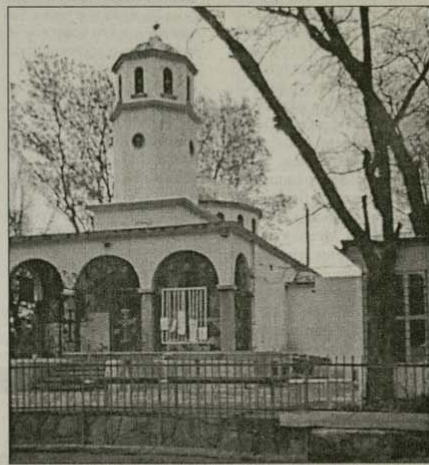
Православният християнски център при храм „Св. Троица“ в Бургас

чер да хапнат по една супа и да преспят на топло. В приземното ще разположат склад за провизии и удобствата за консервиране, трапезария за около 100 човека, а на първия етаж кухня и спални за около 60 човека – мъже и жени. Ще осигурят и постоянен пол-