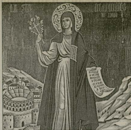
Св. мъца Блaвина Лионска. Православие вв Франция се крепи в подвигa на раннохристиянските мъченици

Толкова сме слушали за Парижката св. Богородица, че в съзнанието ни тя е обвита с мистичност. Пред входа – два човешки потока: единият на влизаните, другият на излизаните. Влизаме. Размерите на пространството трудно се сравняват с нашите човешки мерки. Красивите, филигранно изработени стълболопни събраници от евангелието и изображения на светци са толкова недостижимо над нас, че в желанието си да ги разгледаме, предизвикаме любопитството в околните с вдигнатите си към тавана глави. И за голяма наша изненада и ужас, виждаме над куполите да се реят, осветени в синкава светлина, няколко „ангела“. Напълнени с вата, почти в човешки бой, с крила от бели гирлянди и без глави (!) те висяха самотно над също така самотното множество. Оказаха се част от изложба на модерното изкуство, „приготена“ в ка-