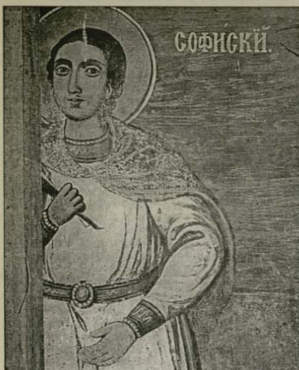
Св. Константин Софийски, църквата „Св. Спас“ в манастира над село Долни Лозен, Софийско, Никола Образисов, 1869 г.