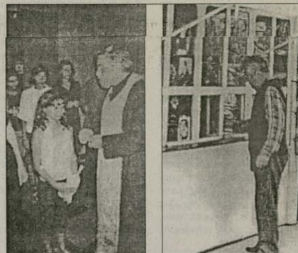
Моменти от душепастирската и социална дейност към енорията. Свещениците и служителите към центъра винаги са готови да откликнат на нуждите на паството

слон за самотни майки и пълнолетни сираци останали без покрив, които ще