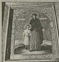
Храмовата икона на св. Кирик и Юлита

На 15 юли храм „Св. мчци Кирик и Юлита“ в гр. Баня отпразнува двоен празник — деня на своите небесни покровители и 70-годишнината от осветяването си.