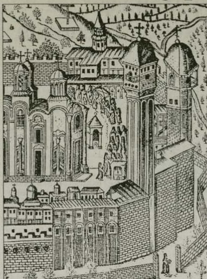
Детайл от цялата с изобразение на Хилендар. Най-вдясно добре се вижда Паисиевият стълп с трите си етажа: куполият параклис „Покров Богородичен“ с чардак на III етаж и двата жилищни етажа със стълбището откъм двора, което води към I етаж. Щампата е от 1779 г. и е копие на по-стари варианти от 1743 и 1757 г.

4. Неистинност на екстериора. Паисиевата келия – триетажната югоизточна кула (стълп) в югоизточния ъгъл на Хилендар – е запазена в съвсем автентичен