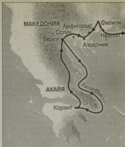
Част от маршрута на св. ап. Павел по време на второто му пътешествие

На следващата сутрин, 24 юни, ние се придвижихме към границата на Св. Гора, до град Урануполис, където се качихме на туристическия кораб „Св. Никола“ и разгледахме от позволените 500 м разстояние крайбрежните светогорски манастири от тази страна: пристанището на българския манастир „Зограф“, след това манастирите „Дохиар“, „Ксенофонт“, руския – „Св. Пантелеймон“, „Симонопѳтра“, „Григориат“, „Дионисиат“ и „Св. Павел“. На кораба бяха донесени от светогорски монах от килията „Св. Никодим Светогорски“ в Карея частича от Честния Кръст и мощи на някои светци, за да се поклонят пред тях желасщите пътници. Макар че имаше и групи от полски и