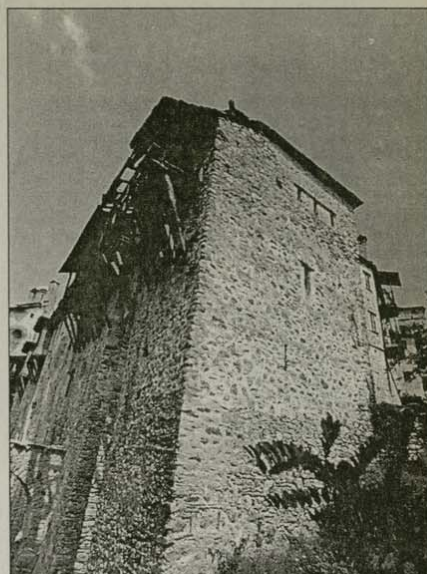
Съвременен изглед на Паисиевия стълп откъм югоизток. Кулата е запазена непокънатата от времето на св. Паисий Хилендарски. По-късните постройки от двете ѝ страни са я направили „невидима“ откъм двора