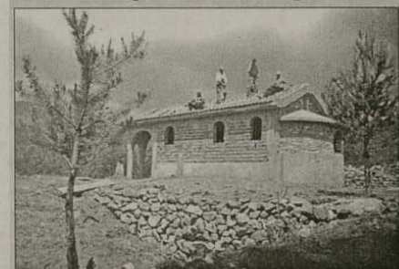
Момент от строежа на новия храм

Споделяме голяма satisfакция, че благодарение на ентусиазма и усилията на населението от с. Добърско, община Разлог, за една година беше възобновена църквата