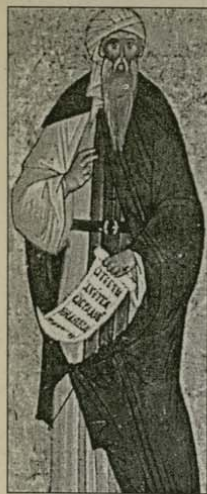
Св. Йоан Дамаскин