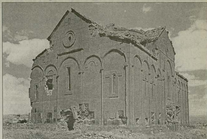
Катедралата в Ани (X в.) един от главните духовни центрове на древноарменска християнска култура