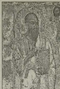
Св. ап. Павел

На връщане през Аполония се отбихме да ви-