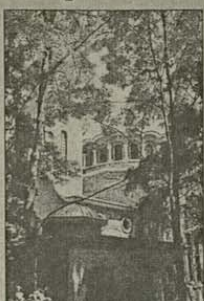
Единственият в България енорийски храм, посветен на св. Кирик и Юлита е построен в гр. Баня през 1932 г. на мястото на малък параклис със същото име

70 години от осветяването на църквата в гр. Баня