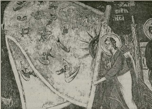
Съзване на небото. Стенопис от Драгалевския манастир, XV в.