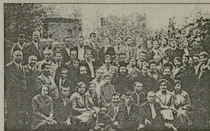
Училищни курсти в Мулдавския манастир „Св. Петка“ край Асеновград, 1933 г.

От юношеските православни дружества едно от най-активните в Пловдив било дружеството „Св. Климент Охридски“ при храм „Св. Троица“. То редовно изнасяло комедии забави в салона и на Четвърта прогимназия. На 26 февруари 1939 г. ученическите православни дружества при девическиката и мъжката гимназия в Пловдив изнасят в салона на Военния клуб общ концерт, на който присъства и Пловдивският митропо-