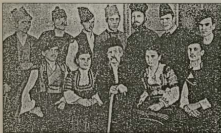
Дружина от юношеското православно християнско дружество „Св. Климент Охридски“ в кв. „Малък Париж“ – Пловдив, след изнасяне на пиесата „Майстори“ от Рачо Стоянов

ра, между които 25 свещеници, учредяват в града православно дружество „Милосърдие“. Дружеството има за цел „да подига народа в религиозно-нравствено отношение чрез църковни и публични речи, да