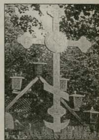
Старият кръст на Кръстова гора

Парацърковният кич не се ражда на Кръстова гора. А ние, православните християни, можем да направим много, щото той да умира там. Заблудените овци съзнателно или не