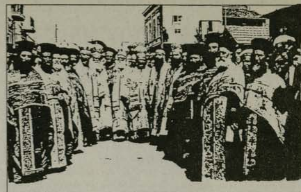
Събор на православните християнски братства