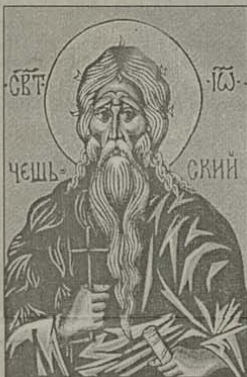
Икона на св. Иван Чешки

казал да я отнесе със себе си, а месото ѝ да раздаде на бедни, за да се молят на Бога за техните души.