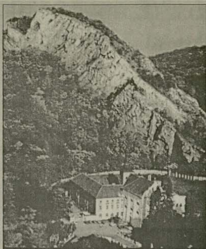
Скалата с пещерата на св. Иван Чешки и общината „Св. Иван (Ян) под скалата“

Един ден княз Борживой Тетински, от известния род Пржемысловичи, дал много князе и крале на чешкия народ, излязъл на лов за мечки. Но кучетата му подгонили една сърна, която се спряла на брега на река Миза и се бранила от кучетата. Княз Борживой слязъл от коня и с меча си я пробод, но внезапно от вимето ѝ започнало да тече мляко, което изненадало много княза и тези, които го придружавали. В този момент от скалата излязъл величествен мъж, който здраво държал в ръката си тояга, бил със, облечен в груба дреха, с много дълги коси и вежди, които се спускали над очите му. Той се обърнал към княза с въпрос: „Защо уби моето животно?“ Князът се стреснал, но събрал сили и попитал: „Заглеждам те в името на Исуса Христа, лош или добър човек си?“ Мъжът отговорил: „Човек съм и недостоен служител на Исуса Христа, а тук живея в името на Света Троица, с помощта на Исуса Христа, света Богородица и свети Йоан Кръстител!“ По молба на княза той му показал пещерата, в която живея, казал му своето име Иван и това на родителите си Гестимулус и Елисавета. А така също, че живее в пещерата четиридесет и две години и никога не е напуснал. Млякото, което му давала сърната; му служело за прехрана. Князът не искал да вземе убитата от него сърна, но св. Иван му