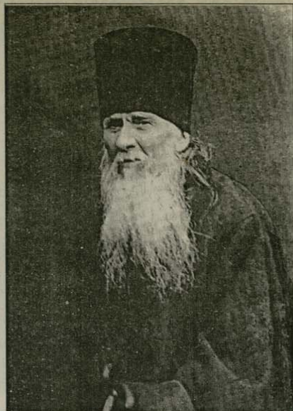
За семейния живот

Никой не бива да оправдава раздражението си с някаква болест – всичко това е от гордост. Защото човешкият гняв не върши Божия правда (Як. 1:20). За да не се предаваме на раздражителност и гняв, не бива да бързаме.