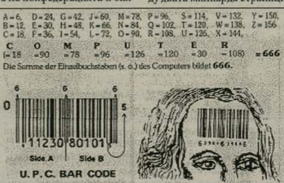
Листовка, разпространявана от сектата на Муун в Германия. Думата „computer“ е „изчислена“ като 666