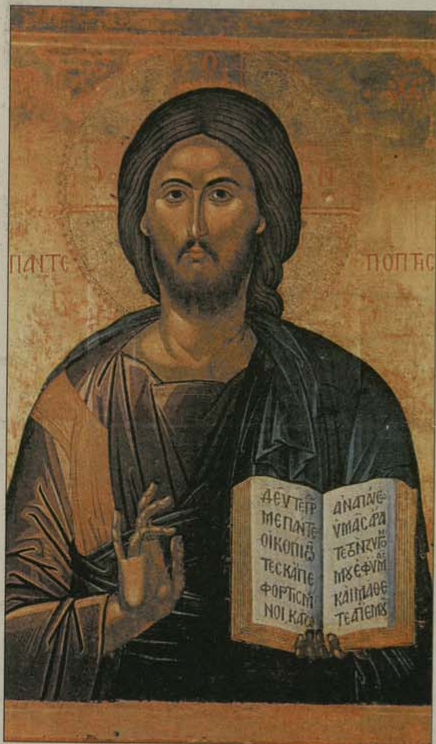
Христос Пантократор Икона от XVI в. от светогорския Иверски манастир