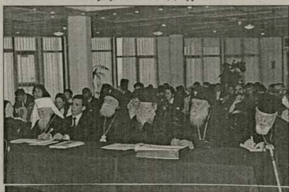
Момент от работата на конференцията с участието на синодални архиереи