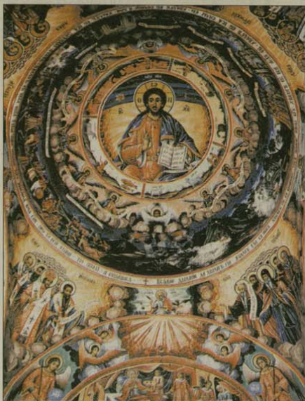
Христос-Премъдрост Божия Стенопис от Димитър Зограф и сътрудници, 1843-1844, централен купол над входа в открития притвор на храма „Рождество Богородично“ в Рилския манастир

Новият храм е бил изписан в периода 1840-1847, доста години след събарянето на стария, тъй че по време на това мащабно ново стенописване единствените запазени стенописи от XIV в. са били в Хрельовата кула. Дали са ги виждали майсторите-образи-