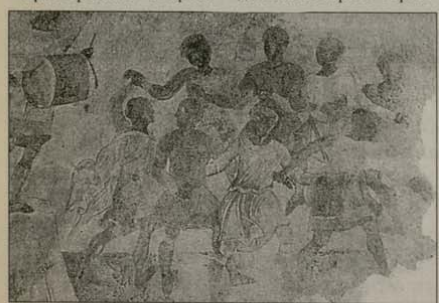
Да хвалит името Му с хоръ. (Псалом 149:3)

Стенопис от притвора на параклиса в Хрельовата кула, около 1335 г.