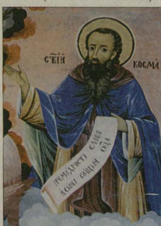
Св. Козма Маюмски

Този псалм е от знаменитите стихове 22 и 23 от глава 8 на Притчи Соло-