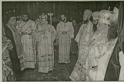
Момент от празничното богослужение в Троянската св. обител

На 29 октомври Негово Светейшество Българският патриарх Максим отбеляза своята осемдесет и осма годишнина, като по традиция отслужи божествена Литургия в Троянската св. обител „Успение Богородично“. В богослужението взеха участие и Високопреосвещените митрополити: Варненски и Великопреславски Кирил, Василей Еласонски (Еладска православна църква), бивш Нюйоркски Геласий, Плевенски Игнатий, Ловчански Гаврил, Преосвещените епископи: Мелиншки Геннадий, игумен на манастира, Знеполски Николай, Високопреподобните архимандрити: Борис, гл. секретар на Св. Синод, Нектарий (Еладска православна църква), духовници от св. обител, протодякон Любомир Братоев и дякон