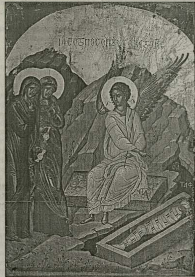
Ангелът на гроба Господен Икона от Теофан Критянин, 1546 г.

Смъртта не е край на нашия живот, а само на неговия земен дял: тя е излаз и врата, през която да минем към спасението и вечността. Затова различните измрения на отношението ни към смъртта и към нашите покойници – илюстративни епифани, канонизациите, отношението към гробовете и пр. – са мерило за нашата духовна зрелост. ЦВ