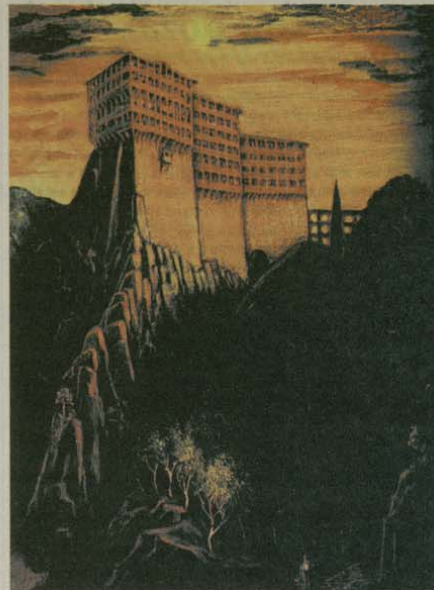
Манастирът „Симонопетра“ в Св. Гора, 1970 г.

Статията „Скъръбщата Божия майка“ е посветена на едноименната икона на тревненския зограф от XIX в. Захарий Цанюв. В нея Цанко Лавренов отдава заслужена почит на великите образци на западното изобразително изкуство от Средновековието до Ренесанса. Влияние от последния период той намира в иконата на тревненския зограф. „При изобразяването на св. Богородица източните иконописци не са смисли да се отдалечат много от византийската традиция. Изключително прави св. Богородица на Захарий Цанюв от Тривна, работена през 1837 г., която представя образа на скръбщата Божия майка.“ Този иконографски тип, сроден с Разпятие Христово, поставя в центъра на иконата не Разпятието, а страданието под него св. Богородица. Нещо характерно повече за западната религиозна живопис, по-малко за православната иконографска традиция. Цанко