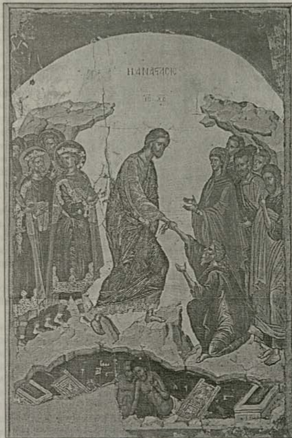
Възкресение Христово (Слизане в ада) Икона от Теофан Критянин, 1546 г.

вилите се, сърцето ни се успокоява. Неположимата скръб, която изпитваме след неправимата загуба, до голяма степен се дължи и на това, че душите на починалите зоват към своите близки за помощ, за молитвена подкрепа. Даването на обяд в деня на погребението, на 40-ия ден и на годиш-