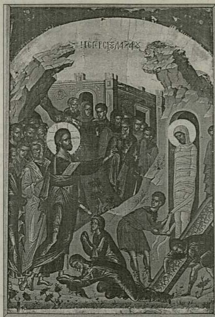
Възкресение Лазарово Манастир „Ставропигица“, Св. Гора – Атон Теодан Критянин, 1546 г.

Из книгата „Тайнството на човешката личност“