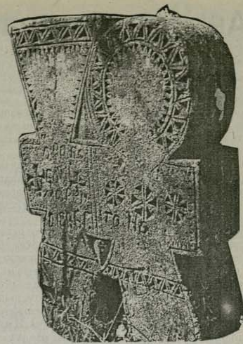
Сърбушки надгробен паметник от с. Красен, Русенско Илюстрация из книгата на Ива Любенова „И гробовете умират“

Ако наистина върваме, че се радваме на непрекъснато и продължаващо общуване с мъртвите, тогава ще гледаме да говорим за тях, доколкото е възможно, в сегашно време, а не в минало. Няма да казваме: „Обичахме се“, „Тя ми е тъй скъпа“, „Толкова бяхме щастливи заедно“. Ще казваме „Ние оцне-