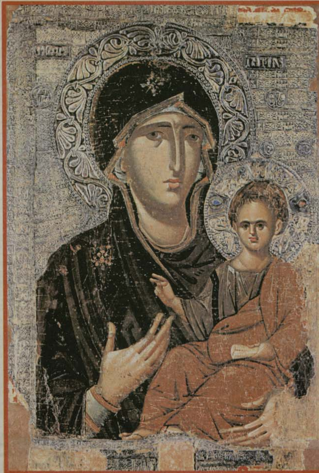
„Св. Богородица Пътеводителка“ от църквата „Св. Климент“, Охрид

ЯНУАРИ: 1 Нова година МАРТ: 3 Освобождение на България АПРИЛ: 27, 28 Възкресение Христово (Великден) МАЙ: 1 Ден на труда 6 Ден на храбростта и Българската армия 24 Ден на бълг. просвета и култура и на славянската писменост СЕПТЕМВРИ: 6 Ден на Съединението 22 Ден на независимостта на България НОЕМВРИ: 1 Ден на народните будители ДЕКЕМВРИ: 25, 26 Рождество Христово (Коледа)