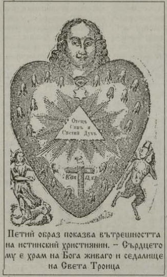
Петни образ показва вътрешността на истинския християнин. - Сърдцето му е храм на Бога живаго и седалище на Света Троица

Но къде приемаме Христа? В ума, в крайниците си, в стомаха? Не, ние Го приемаме в сърцето, което ще рече в цялото си същество, във всяка клетка на тя-