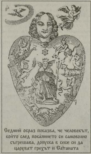
Ведни образ показва, че човекът, който след поканието си самоволно съгрешава, допуска в себе си да царуват грехът и Сатаната

Илюстрации от брошури „Человеческото сърце като храм Божий или седалище на зломо“. Издава Васил Икономов, Солун, 1896 г.