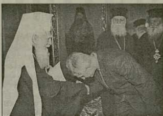
защитава позицията на Св. Синод в парламента при присматането на новия Закон за вероизповеданията.

Същия ден патриарх Максим прие и лидера на БСП Сергей Станишев. Пред Негово Светейшество и синодалните архиереи партийният лидер изрази ясната позиция на БСП, която се ангажира да