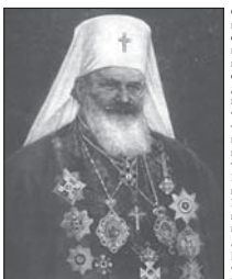
Българският епископ Стефан (1878-1937)

Най-десен е Софийският митрополит Стефан, който в извещения по радио „София“ и в послание към руския народ изяснява, че християнството е едно на цялото славянство, но ще бъде сломан от Русия и нейните съюзници – САЩ и Англия.