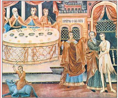
Принтата за Блудния син. Стенпис от Захарий Зограф, Троянска иконостас, 1848 г.