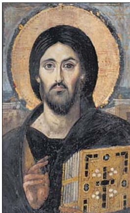
Иконата на св. Исак, обрисуван на равноапостолския иконограф от Египет