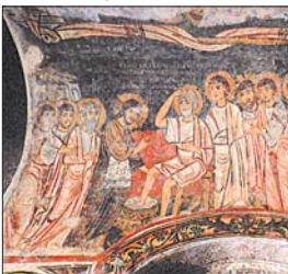
Христос и вълна посетил на училището Си. Спотион от Х в. в църковна „Св. Петър“ в Отриато, Калабрия