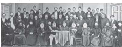
Участниците в Първия църковно-народен събор в Цариград, 1871 г.