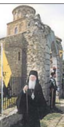
Цариградският патриарх Вартоломей по време на посещение на православните святици в Италия

Мислата на Цариградската патриаршия в Юж-