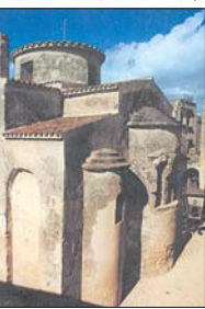
Кръстокупалната църква „Св. Петър“ в Отриато, Калабрия (Южна Италия)