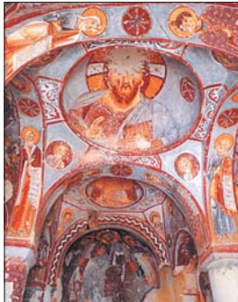
Стенопис от „Ябълковата“ църква, XI в.