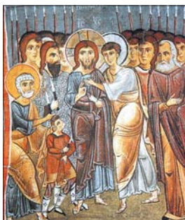
Представлението на Юба. Стенопис от „Тълпата“ църква, XI в.